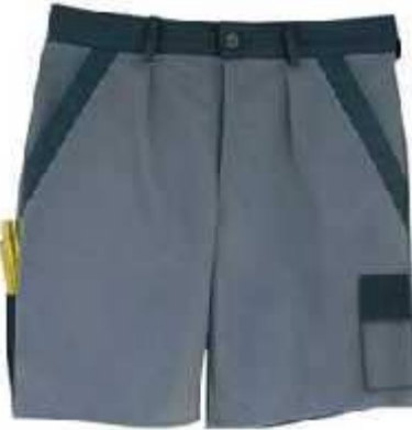
Shorts WINNER CHF 56.00

Grössen: S, M, L, XL, XXL Spezialgrösse: 3+4 XL + 20%