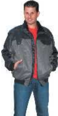
Pilotjacke Winner 2 farbig CHF 162.00